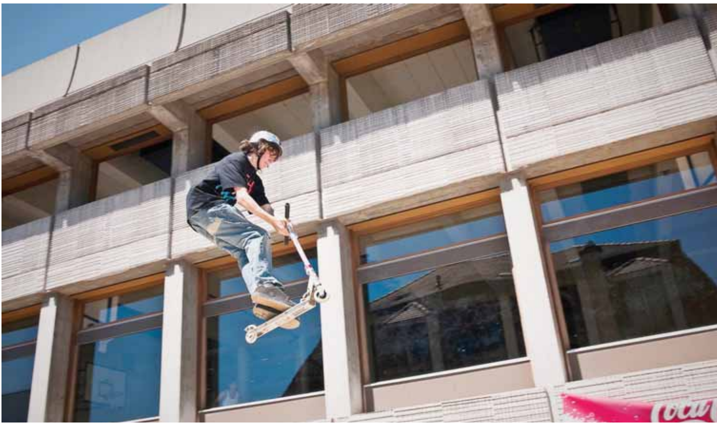
Construit dans les années 70, le collège secondaire de Vigner sera complètement assaini et rénové pour 8 millions de francs.

SAINT-BLAISE Le législatif se penchera sur le futur complexe de Vigner en mars.